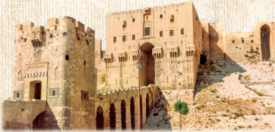
Die Zitadelle von Aleppo